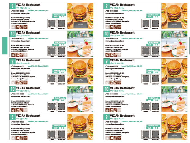
表紙(昨年度制作版)